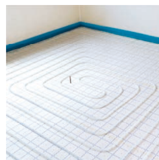
Installazione facile eseguita da un solo operatore.