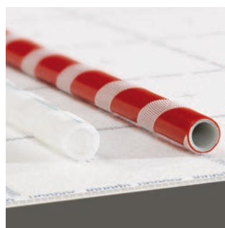
Uponor Klett Twinboard è disponibile con tubazioni Uponor Klett Comfort Pipe PLUS in PE-Xa oppure tubazioni Uponor Klett MLCP RED in multistrato.