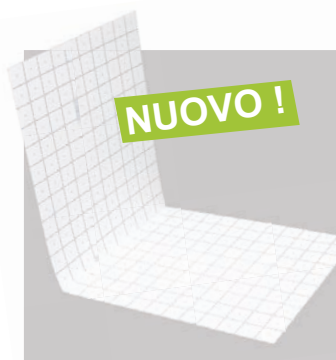
Uponor Klett Twinboard: Dimensioni pratiche di 240x100 cm con un peso di soli 1,9 kg/pannello.