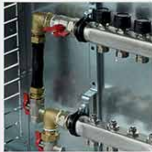
Verticale con contabilizzatore