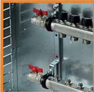
Orizzontale senza contabilizzatore